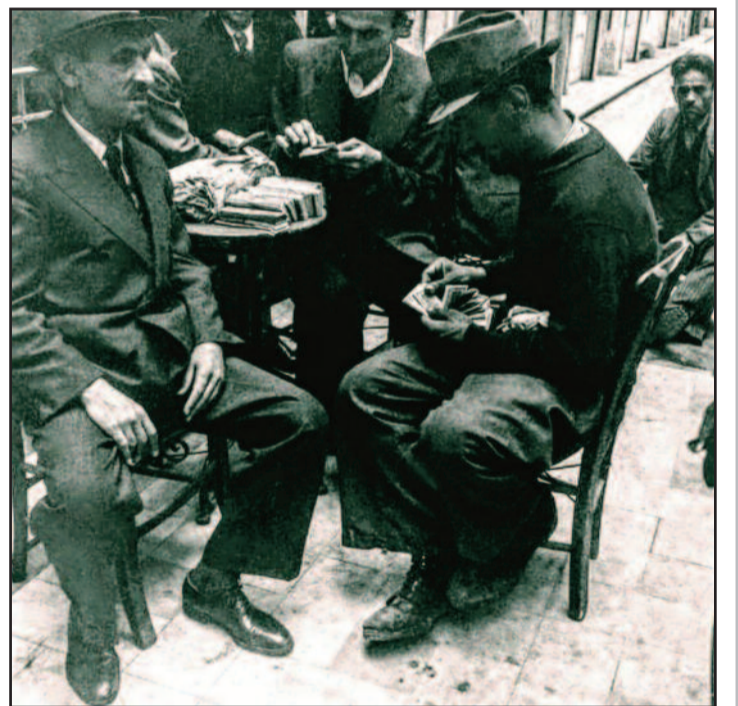
Μερες του 1943. Οι μαυραγορίτες

πληξε την μικροκοινωνία αυτή και κυρίως τα φτωχότερα λαϊκά στρώματα. Συναφώς προσδιορίζεται και καταχωρείται, ο εν τη γενέσει, διαχωρισμός των πολιτών, στην πάνω Πλατεία για τους φτωχότερους, για την προστασία του αφέντη Αη Δημήτρη, με κωδωνοκρουσία, προσδιορίζοντας, την κάτω Πλατεία, για τους έχοντες και κατέχοντες, που αποτελούσαν, το ψειριάρικο άρχοντολόι και θα διαχωρίσουν, για πάντα, το κοινό των πολιτών της Ελατείας.