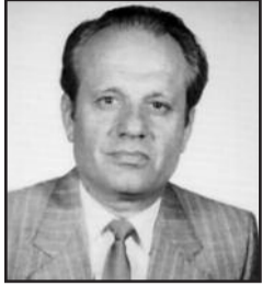
Γράφει ο Ηλίας Σπυρόπουλος Συνταξιοδότης Εκπαιδευτικός

Εκείνο το θρυλικό ξημέρωμα της 28 ης Οκτωβρίου του 1940 ακούστηκε από το στόμα του Ελληνικού λαού, δια του κυβερνήτη του, το ιστορικό, ΟΧΙ στην υποτέλεια, ΟΧΙ στην εκχώρηση της εδαφικής μας ακεραιότητας και της εθνικής μας κυριαρχίας.