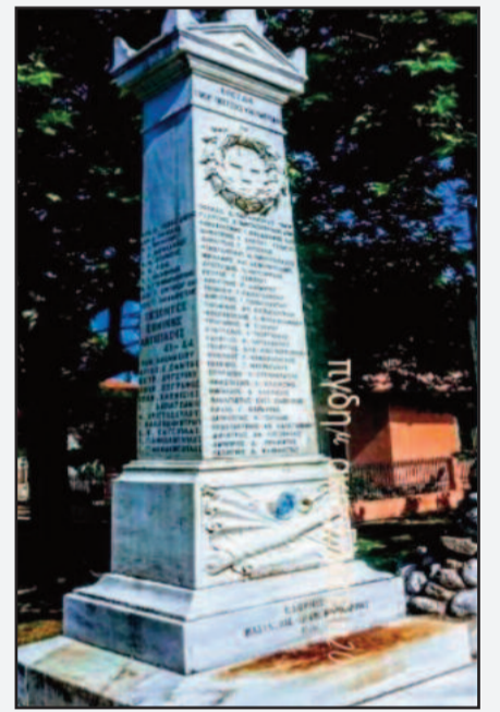
Φωτό 1. Το Εν Ελατεία Σήμα - στήλη των πεσόντων εν πολέμω.

Ο ι ήρωες πεθαίνουν μόνον, όταν οι επιγενόμενοι τούς λησμονούν. Η θυσία τους, που έχει καταγραφεί, στις χρυσές σελίδες της Ελληνικής πολεμικής Ιστορίας, δεν λημονείται και δεν υποβιβάζεται, από το ύψος, που τούς ετοποθέτησε, η Πατρίδα, στα Ηρώα των Πεσόντων, αλλά και στους καταλόγους τιμηθέντων, με διακρίσεις στα πεδία των μαχών, υπέρ Πατρίδος. Στην στήλη, των πεσόντων Ηρώων στην Ελατεία, Φωτό 1, αναγράφονται τα ονόματα αυτών, που έδωσαν τα νιάτα και την ζωή τους, τούς οποίους πρέπει, να θυμόμαστε πάντα, όχι με ανιαρά επαναλαμβανόμενες, ομιλίες γενικού ενδιαφέροντος, αλλά εστιάζοντας και επικεντρώνοντας στους δικούς μας νεκρούς, δαπανώντας λίγο χρόνο, αναμοχλεύοντας τα ιστορικά γεγονότα, μέσα από τις θυσίες των δικών μας προγόνων, γιατί η Ιστορική μνήμη, πρέπει να μείνει ζώσα και οριζόντια, οι καιροί αλλάζουν.... Οι μεγάλες ιστορικές επέτειοι, υπάρχουν, για αυτόν ακριβώς τον λόγο, και αυτό, το επικαιροποιούμε τώρα, ακόμη μία φορά, με την περιγραφική της Επετείου του 1926, δια χειρός του συμπατριώτη μας, ανταποκριτή της Αθηναϊκής εφημερίδος ΣΚΡΙΠ, που είναι τόσο παραστατική και λεπτομερής, ώστε δεν χρειάζεται προσθαφαιρέσεις. ΦΩΤΟ 2. Διαβάστε με προσοχή, τα γεγονότα γραμμένα, στην αυστηρή τρέχουσα γλώσσα, με μία ισχυρή αύρα συγκίνησης, να διατρέχει το κείμενο.