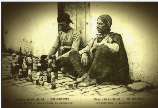
Φωτο 2. Υπαίθριοι πωλητές βδελλών στη Θεσσαλονίκη