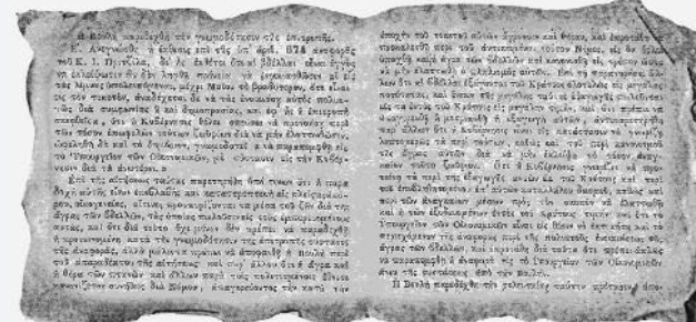
Φωτό 4. Πρακτικά Βουλής σελ. 1005 27 Απριλίου 1845 Ρ Λ Γ'