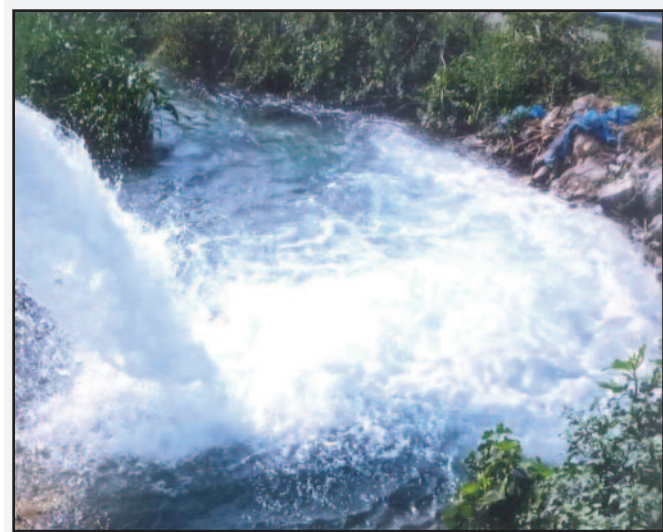
Φωτό 1. Η πηγή Σέλκη (Shelk-I αλβ. Ιτιά). Η υδροφορία της χώρας της Ελάτειας και σήμερα παρά τις υδροληψίες είναι ακμαία.

Πρέπει να πιστωθῆι η πρόνοια αυτή στα θετικά της Βαυαροκρατίας, όπως και η συνέργεια της ανανεωτικής πνοής της 3ης Σεπτ. 1843.