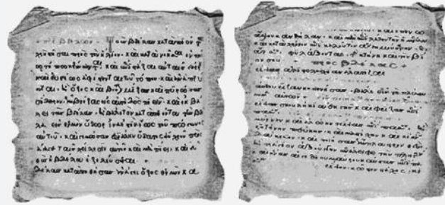
Φωτό 3. Χειρ. ΚΩΔ. Ε.ΒΕ. 2922 14ου αιώνα + LEXICON BOTANICUM CUM Aelliis Alexandrinus promotus Alexandrini με ποικίλας ιατροσοφικής συνταγάς στο περιθώριο.