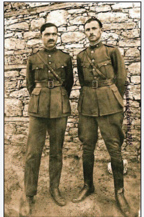
Φωτό 3 Έξω από το στρατιωτικό νοσοκομείο Θεσσαλονίκης 1919-20 [δεξιά]