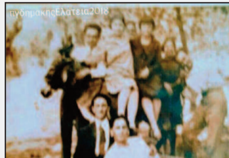
Φώτο 1. 1928. Υπέροχη ημέρα εκδρομής, καλή συντροφιά, η προοδευτική νεολαία τής Ελάτειας, συνωστίζεται επί και περί τού υπομονετικού γαϊδάρου. (Αριστερά κάτω).

Γράφει ο Παν. Γεωρ. Δημάκης, Υπεύθυνος Ιστορικού Αρχείου Δήμου Αμφικλείας Ελατείας • Email: pgdimakis@gmail.com