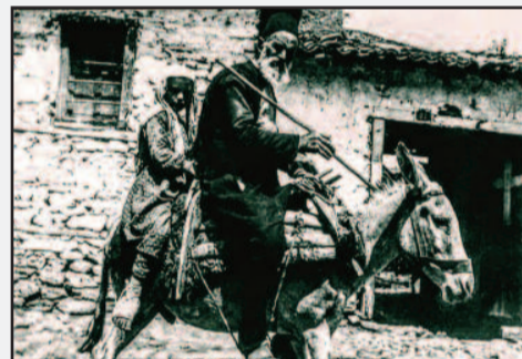
Φώτο 2 Και ένας και δύο έστω πισωκάπουλα.