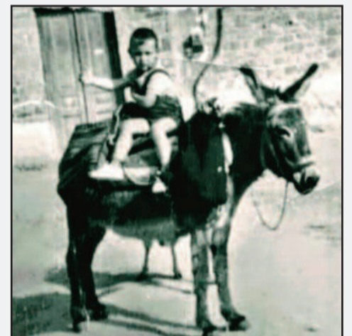
Φώτο 5 Χαλαρά....

νομένων... Σκόλυμος **, Όνωις, Ονάκανθα, Ονόπορδον, Ηρύγιον, Αγρια γκινάρα και Ζοχός και Κνήκος και Νεροκράτης και Κουτλουτζές, είναι μερικά, από αυτά, πού αποτελούν την δέση των λαχάνων, πού προτιμούν οι όνοι. Ονοβάτις καλείται παρά Πλουτάρχω γυνή γαϊδουροκαθισμένη, επίσης γαϊδουρόσφακα, φλομής, θραυλλής... είς ελλύχνια χρήσιμος, είναι ελάχιστες από τις λέξεις, πού διασώθηκαν, στις χιλιετίες τής συνάφειας, των συμπασών τετράποδων συντρόφων μας, πού η δραματική αλλαγή, των συνθηκών τού ανθρώπινου βίου, αχρήστευσε και έθεσε στο περιθώριο, με αποτέλεσμα σε λίγο καιρό, να αποτελέσουν δείγματα τών ζωολογικών κήπων. Τα γαϊδούρια, τα γ'μάρια, τα σύμβολα τής υπομονής και τής υποταγής, πού γνώρισαν μέρες δόξης, για την μνημειώδη ικανότητα, σε έργα μεταφορικά, σε μονοπάτια και δύσβατα όρη, αρκούμενα στην ελάχιστη τροφή, ακόμη, το μεγαλύτερον να είναι οδηγό καραβανιών (βλ. Σημ.....) και τελετουργικά, αλλά και τιμητικά να συμμετέχουν, σε δρώμενα, με αφιερώσεις αρτόσχημες, σε Μύλους, κατά την Αρχαιότητα. Ακόμα και σήμερα, εξετάζοντας τα θετικά τών γαϊδουριών προτερήματα, αξιολογείται υπεροχή, σε προσόντα όπως η υπομονή, η αντοχή, η προσήνεια και η φιλική διάθεση.