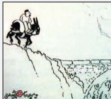
Φώτο 3 Απροσδόκητη συνάντηση