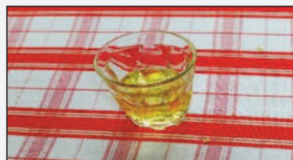
Και φυσικά ο εξαίρετος σπιτικός οίνος από τοπικές αμπελοποικιλίες.

Η Λειτουργία, η ευλογία των Ιερέων, η λέξις της Θυσίας, το Χριστός Ανέστη που ψάλλεται ομαδικά, το τερπνό και χαριέστατο τοπίο, η περιρρέουσα ατμόσφαιρα, που αναδίδει ευωδία πνευματική, η συνεισφορά που χαλαρώνει και συσφίγγει τους δεσμούς, αυτής της μικροκοινωνίας, που επιμένει στα αρχαία δρώμενα, είναι μία άλλη Ελλάδα, που αντιστέκεται, άς ελπίσουμε όχι ματαίως.