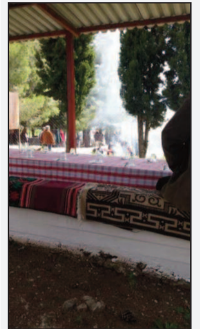
Η Τράπεζα περιλαμβάνει όλα τα καλούδια της περιοχής, πίτες διάφορες, τυριά ντόπια και άλλα σε επάρκεια.

ρωθεν στάνες και είναι δεκτοί ως συνδαιτυμόνες όλοι ντόπιοι και πανηγυριστές και περαστικοί, αναβιώνοντας την πανάρχαια Ελληνική Φιλοξενία, σ' ένα χώρο που βρίσκεται, εν οπτική επαφή με τις δύο πολυμηνηνικές, πανάρχαιες Φωκικές πόλεις, την Υάμπολη και τις Αβές.