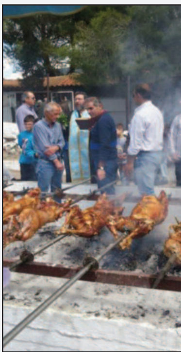
Ο Ιερεύς ευλογεί τα Ιερεία.