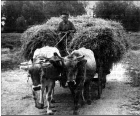
Κάρο τετράτροχο με βόδια