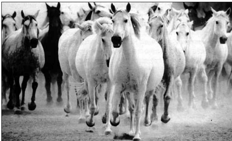
Αγέλη αλόγων.

Στην Αθήνα και στις λοιπές μεγαλουπόλεις της χώρας μας, ο μανάβης, ο νερουλάς, ο καρβουνιάρης και πολλοί άλλοι επαγγελματίες γυρολόγοι με τη βοήθεια του αλόγου ανέπτυξαν τη δουλειά τους κι έζησαν τις φαμίλιες τους.