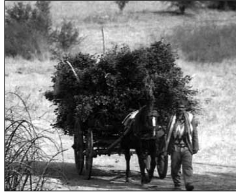
Κάρο τετράτροχο με άλογο

άδοξη καρδιά του δημιούργησε άρρηκτους δεσμούς με την πατρίδα του Ελλάδα. Στη θαλπωρή του φτωχικού του σπιτιού ανάστησε γενιές παιδιών μεταλαμπαδεύοντας τη φλόγα της ζωής και τον πόθο της δημιουργίας. Με την ευχή του ξεπροβόδισε νέφες και γαμπρούς προς τους ιερούς χώρους της εκκλησίας για τον υμέναιο του γάμου. Στην κρυφή του χαρά κανάκεψε εγγόνια, και στις πατρίδας τον κίνδυνο, ευλόγησε τη φυγή των παιδιών του στα βουνά του κλεφταρματωλικού αγώνα, στην εκστρατία της Μικρασίας, στα χιονισμένα βουνά του Αλβανικού μετώπου.