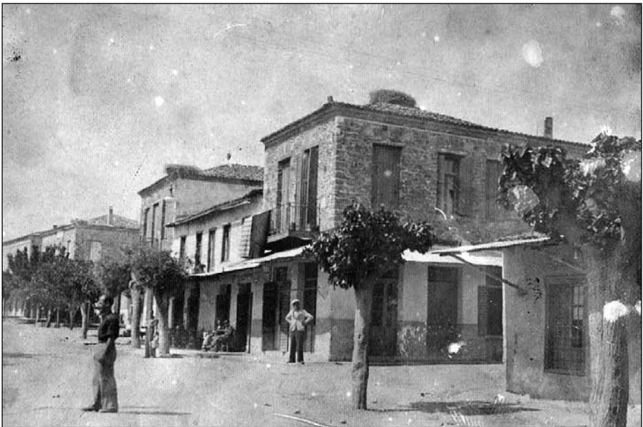
Η δυτική πλευρά της αγοράς του Μώλου. Φώτογρ. 1937 περίπου

Η περιέργεια μας καθήλωνε ώρες στο πεζοδρόμιο, ακροατές απέναντι στο παράξενο αυτό μαγικό φαινόμενο, στο εσωτερικό του οποίου η αχαλίγνωπη παιδική μας φαντασία τοποθετούσε μαγικές μικροσκοπικές υπάρξεις από οργανοπαίχτες και τραγουδιστάδες, καθώς τα ερτζιανά κύματα μετέφε-