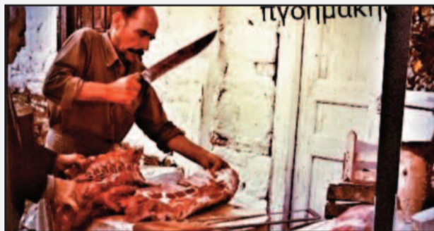
Φωτό 4. Σκηνή κοπής κρέατος, με μάχαιρα κρεοκοπής, δεκαετίας 1980, με ξύλο κοπής, τράπεζα επεξεργασίας και τα υπόλοιπα, λιγοστά συγύρια, τσιγκέλια, μαχαίρια, σουβλιά, μασάτια κ.λ.π.