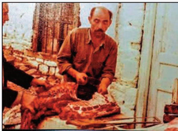
Φωτό 5. Η μάχαιρα διαμελισμού του σφαγίου, ήταν χειροποίητη, έργο συνήθως ντόπιων χαλκιάδων-μαχαίραδων, παραλλαγή πολεμικής, με ζυγισμένη λάμα. Τότε το "γαλάτωμα" των τοίχων, με ασβέστη άσβεστο, ήταν η πιό ασφαλής, για τήν εποχή μέθοδος απολύμανσης.