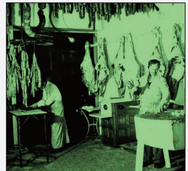
Φωτό 7. Κοπή κρεάτων, σε νεότερο κρεοπωλείο, με μικρές διαφορές στην διάταξη και έκθεση των κρεών και παραγωγών σκευασμάτων, χωρίς ουσιαστικές διαφορές.