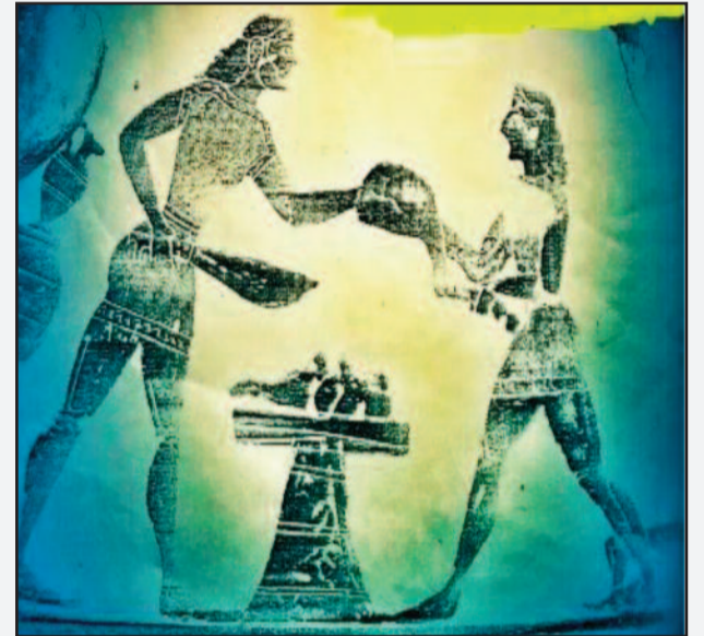
Φωτό 6. Πολλές ομοιότητες στην κοπή των κρεάτων, με τήν αρχαία πρακτική, πού φαίνεται να βρίσκει τρόπους, να συνεχίζεται, με τήν μάχαιρα και τήν τράπεζα κοπής....