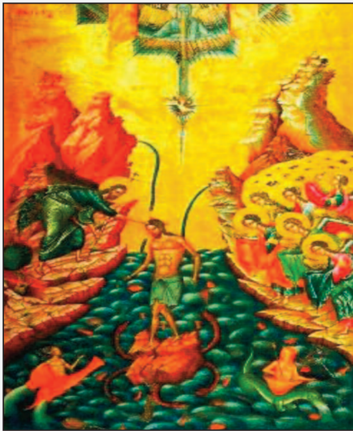
Φωτο 1. Δείγμα γραφής του Ονούφρι

Γράφει ο Παν. Γεωρ. Δημάκης, Υπεύθυνος Ιστορικού Αρχείου Δήμου Αμφικλειάς Ελατίας • Email: pgdimakis@gmail.com