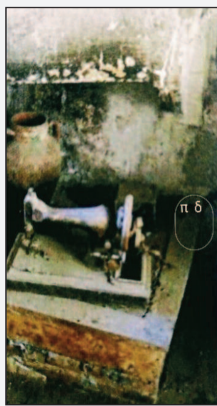
Φωτο 2. Ραπτομηχανή BRUNONIA 1880. Μία χειροκίνητη, επιτραπέζια ραπτομηχανή, ευρεθείσα στα έγκατα, ενός αγροτικού σπιτιού, μάς αφηγείται το ταξίδι της, μέχρις εδώ.

Τα φωτογραφικά τεκμήρια, είναι πολύτιμο αρχαιολογικό υλικό, όχι μόνο νοσταλγική επιστροφή...οι ραπτομηχανές SINGER σημ.. (κυριαρχούν ήδη και εμφανίζονται στο προσκήνιο εδώ, αποτελούσαν μάλιστα και στοιχείο προίκας. Στο προικοσύμφωνο της μητρός μου, το 1932, αναφέρεται μία αγελάδα, που εδίδετο τότε προικώα, για την συμπληρωματική κυρίως διατροφή των παιδιών, ή οποία, αμέσως ανταλλάχτηκε, με μία ποδοκίνητη ραπτομηχανή SINGER (βλ. φωτο 3) και στην οποία, μαθήτευσαν, σειρές από συγγενείς και φίλους και γείτονες, ράβωντας και γαζώνωντας, σκουτιά και προικιά και παραφερνάλια της οικουσκευής).