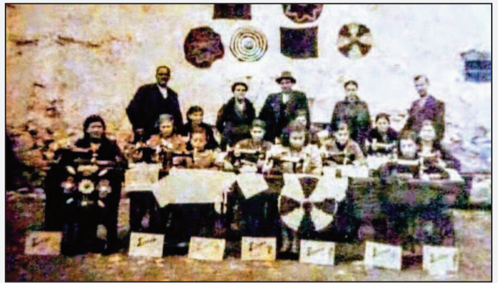
Φωτο 1. Αίθουσα παλαιού δημοτικού σχολείου Ελατείας 1930. Έκθεσις χειροτεχνημάτων. Μαθήτριες και Διδάσκαλοι. Τα φωτογραφικά τεκμήρια είναι πολύτιμο αρχαιολογικό υλικό, όχι μόνο νοσταλγική επιστροφή...οι ραπτομηχανές SINGER στο προσκήνιο, αποτελούσαν μάλιστα και στοιχείο προίκας.

Η Ελάτεια, της εποχής αυτής, απολάμβανε ακόμη, τα προνόμια της οδικής και εν πέρατι, θαλάσσιας σύνδεσης, μέσω των οδικών αξόνων, που διασταυρώνωνταν ακριβώς εκεί, Αταλάντης-Ελατείας-Γραβιάς-Άμφισσας-Ιτέας και Λαμίας-Ελατείας-Λεβαδείας-Θηβών-Αθηνών, που ήταν και ταχυδρομικές και τηλεφωνικές αρτηρίες...μέχρι νεωτέρας.. Αυτό, ακολουθούσε και η εμπορική δραστηριότητα και τα καταναλωτικά προϊόντα τότε, ότε η πρωίμη παρουσία, της ραπτομηχανής BRUNONIA, κα-