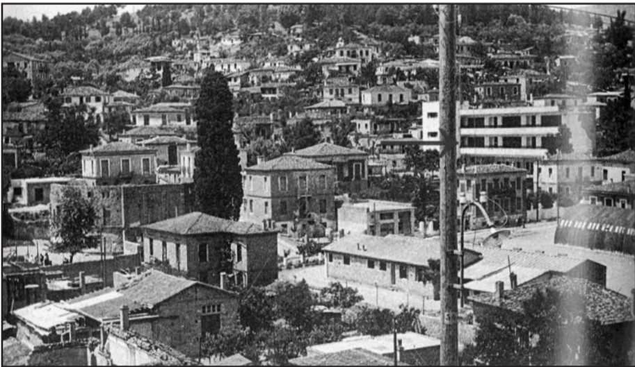
Ο χώρος όπου χτίστηκε το Δημοτικό Θέατρο Λαμίας. Δεξιά διακρίνονται τα τοπ (μεταλλικά κτίσματα) και στο βάθος το 2ο Δημοτικό Σχολείο.

Σύμφωνα με γραπτές μαρτυρίες και με τον ορατό, έως ότου κατεδαφισθεί, «σκελετό» του θεάτρου, η πρώτη προσπάθεια για ανέγερση μόνιμου θεάτρου στη Λαμία άρχισε στις αρχές του περασμένου αιώνα με ιδιωτική πρωτοβουλία και με τη βοήθεια του ομώνυμου Δήμου. Η ανέγερση άρχισε με τη χρηματοδότηση του Οδυσσέα Κοτσοκέρα (2) εντός δημοτικού οικοπέδου, που βρισκόταν δί-