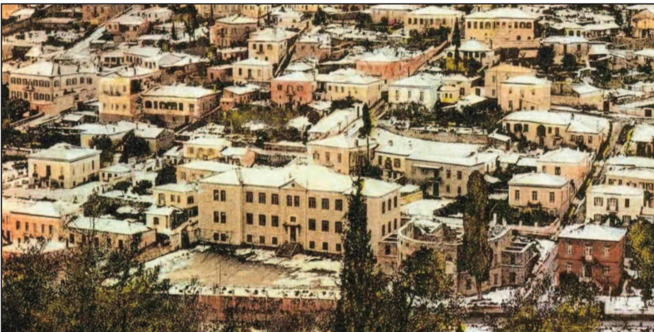
Η Λαμία χιονισμένη (1920). Διακρίνονται το "Πέτρινο" (αρχικά Παρθεναγωγείο και μετά Γυμνάσιο) και δεξιά το "Πάνειον" Θέατρο ημιτελές