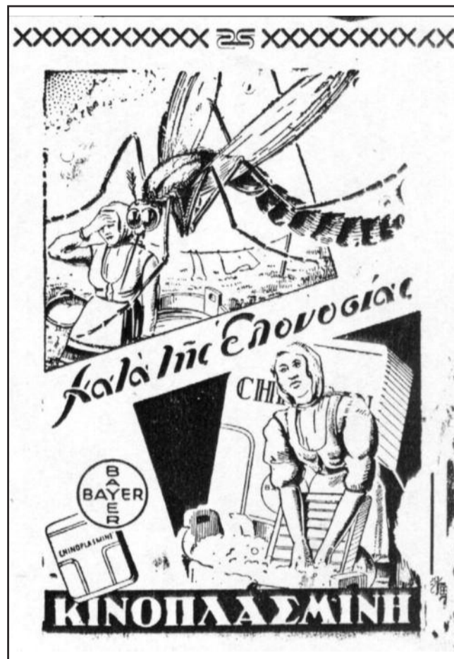
Από διαφήμιση (εφ. Η ΕΠΑΡΧΙΑ, 1936)

Μια τραγωδία σημειώθηκε το Φεβρουάριο του 1935 με τρεις θανάτους 40 από λύσσα στην ίδια οικογένεια. Έγινε σε χωριό του Δομοκού από δάγκωμα γάτας (πριν μήνα) σε παιδί 12 ετών. Την ίδια ημέρα πέθανε η μητέρα του παιδιού και την επομένη πέθανε και το άλλο παιδί της οικογένειας.