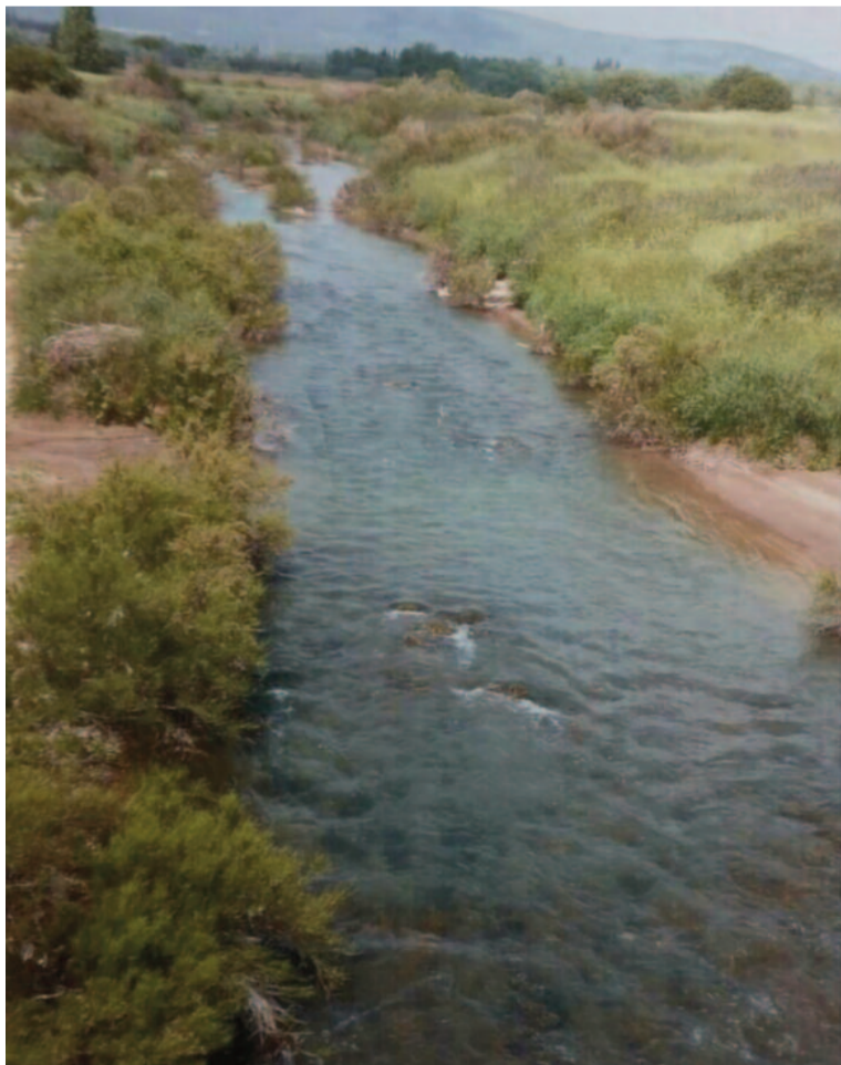
Ο Κηφισός στο Μοδιάτικο γεφύρι της Λεύκας, τα διάφανα νερά του, υμνήθησαν στα Ομηρικά Έπη (Πλούταρχου Βίος Θησέα, Παιουανίας ΙΧ 37).

Όμως οι φιλιότορες, λόγω του όγκου, των σχετικών προς τις μυθολογικές ερμηνείες, των ανωτέρω γραφέντων, θα πρέπει να λάβουν τον κόπον και την ευχαρίστησιν, να αναγνώσουν τα σχετικά, αναλυτικότερα εις τον τόμον "Το εν Αθήναις Αρχαιολογικον Μουσείο εκδ. Μπεκ και Μπαρτ σελ 317-323".