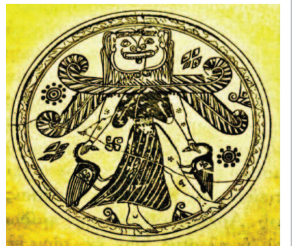
Μυθολογική φερωτή μορφή (Άρπυια;) που πνίγει σε κάθε χέρι, ένα χίνα, ροδιακό πινάκιο. (Βρεταν. Μουσείο)