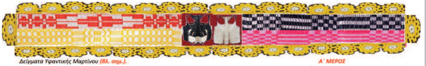
Δείγματα Υφαντικής Μαρτίνου (βλ. σελ.).

* Η στρατιωτική ζωή εν Ελλάδι επιμ. Μ. Vittι Αθήναι 1978. Διήγησης Ανωνώμου «... τό εσπέρας, όταν έφάνη τό Μαρτίνι, όπου έπρεπε να μας