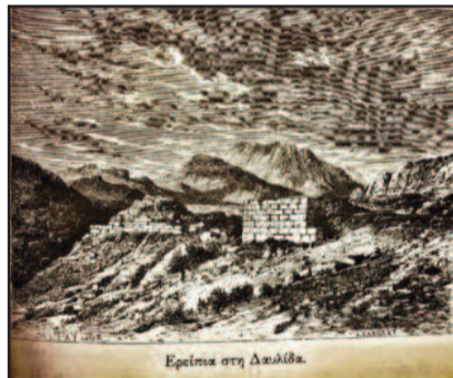
Ερείπια στη Δαυλία.

Σημ 1 Σχολιάζοντας την φράση του Δραγούμη. ...επί πρίνου...ερρίφθην και παρεδόθην...δεν θα παραλείψουμε να εγκωμιάσουμε, την σπάνια περιγραφή αυτή, μιάς πρακτικής των ποιμένων του Παρνασσού, τις βροχερές χειμωνιάτικες ημέρες, όπου επέλεγαν ένα κομποφυραρο η ένα πυκνό όστρο, για να ξαπλώσουν διπλώνοντας την γιδοκαπα, που ο Δραγούμης αποκαλεί χλαινη, με τρόπο που ονομαζόταν "ραφ'τκουζ", ώστε σε ύψος από το έδαφος, λόγω της φυτικής σκληρής μάζας, να αποφεύγουν την υγρασία και τα νερά, αφού οι γιδοκαπες ήσαν αδιάβροχες, όχι για όλο το σώμα βέβαια. Πράγματι όποιος έχει κατακλιθεί κατάκοπος έτσι, θα θυμάται εφ' όρου ζωής την αξεχαστη στιγμή, με την μυρωδιά τού πρίνου και τού σκίνου, το βεβαιώνω ως παλιός κυνηγός και ορειβάτης.