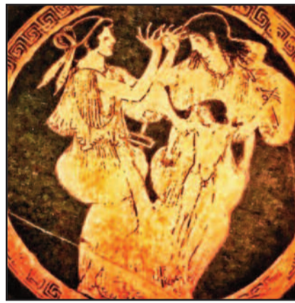
Ερυθρομορφος κυλικας 5ου αι. π.κ. (Μουσείον Λούβρου)

Και ταύτα μεν πανθ' όσα φέρονται περί του μαντείου τού Απόλλωνος και περί τού τρόπου της κατασκευής αυτού και του αρχιτέκτονος, εγώ δε συναντώ ευθύς ως καταφθάνω επί του ιερού τόπου και ορώ πηγήν κατά τα δεξιά και ύπερθεν αυτής αναβαθμίδας λελαξευμένης επί τού βράχου, διπκούσας δε μέχρι ανοίγματος μεγάλου, ού εις το άκρον χαινει βάραθρον και ούτινος, ύπερθεν λέγεται ότι έκειτο ο Τρίπους, επί τού οποίου αναβαίνου ο Πύθιος Απόλλων εμαντεύετο τούς λοζούς εκείνουσ χρησμούς, οίπινες και εζητούντο συχνότατα. Επί τού βράχου αυτού εύρον διάφορα άνθη άγρια, ύν μεταξύ και ανωμώνην. Τα άνθη ταύτα φυλάσσονται επιμελώς και ευλαβώς υπό φιλιτάτης μοι αυταδέλφης. Καταβαίνω τας αναβαθμίδας και προχωρώ. Ευρίσκομαι απέναντι χώρου ευρέως ούτινος εις τας παρειάς ή κάλλιον τας πλευράς, εκ λίθου μαρμαρίου κατασκευασμένας ορώ μυριάδας επιγραφών. Ο χώρος ούτος εις το εμβεδόν περιέχει ποικίλλα γεωμετρικά. Το σύνολον του χώρου με βεβαιοί ο εξηγητής ότι ην το μαντείου ή ο ναός του Απόλλωνος. Ο μέγας αρχαιολόγος Μύλλερος, αναγινώσκων τας επιγραφάς ταύτας προ πολλών δεκαετηρίδων και εκτεθειμένος εις την επίδρασιν των καυστικών ακτίνων του πλίου προσεβλήθη ο τάλας υπό τύφου και υποκύψας εις την νόσον απέθανεν, ο δε τάφος αυτού εύρηται επί του Κολωνού, δεξιά τω βαίνοντι εις την Κολοκυνθούν. Οι Δελφοί επί των οποίων ευρίσκετο το χωριόν Κασοτρί ερειπωθέν υπό του σεισμού ός έσεισε την Φωκίδα εν έτει 1871 ανωκοδομήθησαν διά καλύβων εκ ξύλου, εις μίαν των οποί-