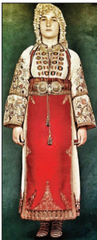
Η παλιά λαμπρή νυφική φορεσιά Αραχώβας. (Αγγελική Χατζημηχάλη, Ελληνική λαϊκή φορεσιά).

λέων δε των εν Λέσβω Πιπτακός Μιτυληναίος, εκ δε Δωριέων των εν Ασία Κλεόβουλος ο Λίνδιος και Σόλων τε Αθηναίος και Σπαρτιάτης Χίλων. Ο δε έβδομος Πλάτων ο Αρίστωνος, αντί Περιάνδρου του Κυψέλου Μύσωνα, κατείλοχε τον Χηνέα. Ούτως, αφικόμενος εις Δελφούς, ανέθεσεν τω Απόλλωνι τα αδόμενα Γνώθι σαυτόν και Μηδέν άγαν, ως ιστορεί ο Πausanias εις τα «Φωκικά» Liber X§ XXIV, γράφων επί λέξεισιν «εν δε τω προνάω τω εν Δελφοίς γεγραμμένα εστιν οφελήματα ανθρώποις ές βίον, εγράφη δε υπό ανδρών ούς γενέσθαι σοφούς λέγουσιν Έλληνες»