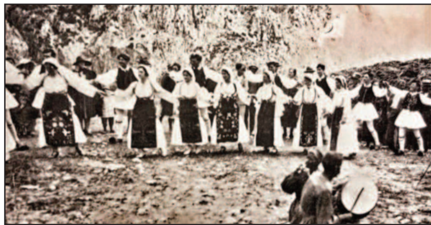
Υπαίθριος χορός στο Κασοτρί (Δελφοί) - Φωτό: Α. Χατζημηχάλη, Ελληνική λαϊκή φορεσιά.

Παρέμεινα εν Αραχώβη επί πολλάς ημέραις ίνα περαιώσω τας ανακρίσεις και κατοπίην, επειδή η απόστασις του εν Φωκίδι μαντείου των Δελφών, από της Αραχώβης είνε σύντομος, απεφάσισα να επισκεφθώ αυτό και να θαυμάσω, τον ναόν του Απόλλωνος, εις όν ην αναγεγραμμένον το «γνώθι σ' αυτόν» και το «μηδέν άγαν». Οι σοφοί Έλληνες, εκ μεν Ιωνίας Θαλής μεν Μιλήσιος και Βίας Πρινεύς, Αιο-