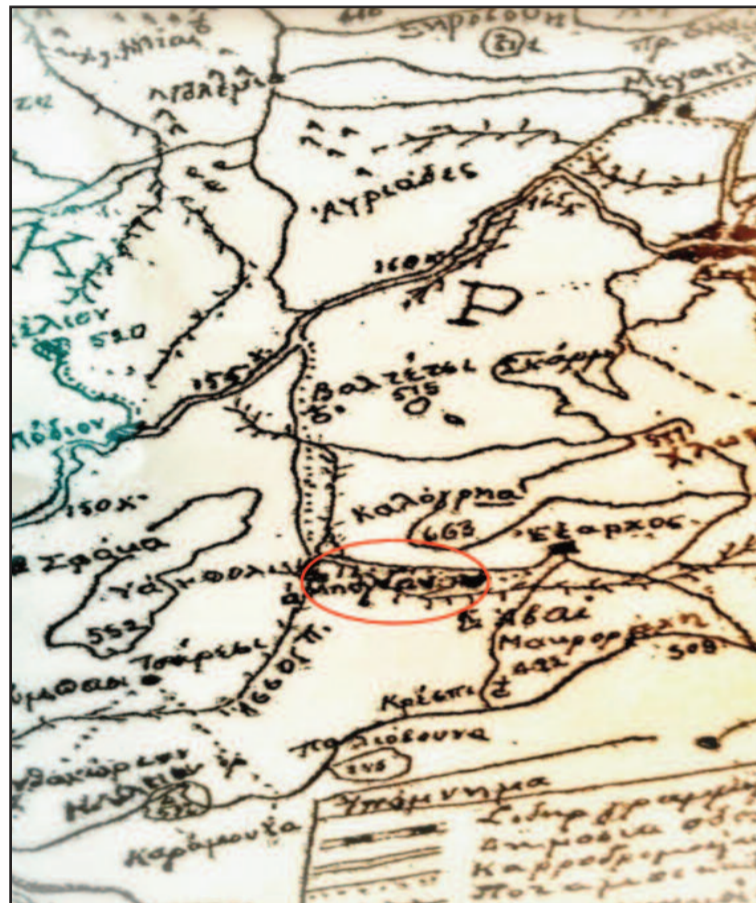
Χειρόγραφος αθημοσίετος χάρτης της Λοκρίδας, έργον του μηχανικού Λεων. Ζερδέ, κατ'εντολήν του Διοικητικού Συμβουλίου των εν Αθήναις και Πειραιεί Λοκρών, το έτος 1935. Πρόκειται για ενδιαφέρουσα εργασία, με λεπτομέρειες της Λοκρικής τοπογραφίας, από ένα γνώστη της περιοχής. Το ιστορικό αρχείο του Δήμου Ελατείας, επιφυλάσσεται σύντομα να δημοσιοποιήσει τον χάρτη αυτό, με τα του συμπατριώτη μας, από το Μεραλί Λ. Ζερδέ απαραίτητα σχόλια.

Οι M.kiel-F.Sauerwein, Ost lokris στην εργασία τους... Passauer Mit.studien..καταγράφουν, όπως δηλώνονται, τα ρωμέικα χωριά Karye-i Rum και τις αρβανίτικες ημινομαδικές εγκαταστάσεις, Katuna Arpanudan, ενώ υπάρχουν φορολογικές καταγραφές και για εγκαταστάσεις με ολαβικές ονομασίες, όπως το Μπογκντάν (Μπόγδανος), ίσως παλαιότερες και του Εξάρχου, προφανώς είχαν προηγηθεί, από την αδυναμία ελέγχου της περιφέρειας, από την κεντρική διοίκηση των Βυζαντινών και αργότερα των Φράγκων, που μοίραζαν φέουδα και τιμάρια και πρόνοιες, κατά τις συγκυρίες που τους ευνοούσαν, για την σχηματοποίηση της επικρατείας των. Η σκοτεινή αυτή περίοδος, ελάχιστα μελετημένη, έχει σημαντικά στοιχεία, με ιστορικό, εθνολογικό, γλωσσολογικό και λαογραφικό, ενδιαφέρον, αλλά και τεράστιο εξελισσόμενο όγκο πληροφοριών, όθεν οι φιλόστο-