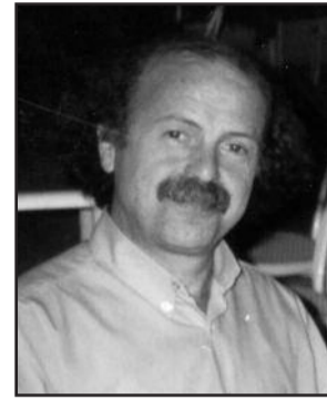
Γράφει ο Κων/νος Αθ. Μπαλωμένος φυσικός

Στα μεγάλα ονόματα, που γεννήθηκαν στη Λαμία ή βρέθηκαν εδώ και εργάστηκαν μία ή περισσότερες δεκαετίες, οφείλουμε να αναφέρουμε τη Βούλγα Παπαϊωάννου και τον Ανα-