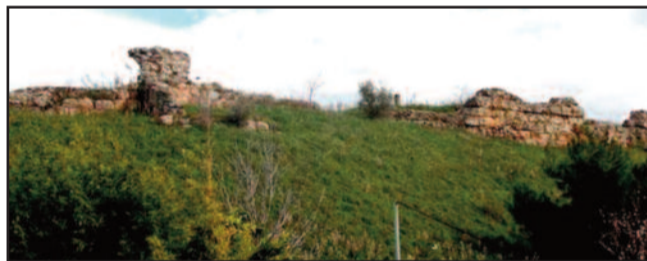
Τμήμα οχυρώσεων Ωρεών Ευβοίας

Εν συνεχεία ο Φίλιππος επέστρεψε στη Σκοτούσσα όπου άφησε τον κύριο όγκο του στρατού. Παίρνοντας μαζί του μόνο τους ελαφρά οπλισμένους και τη βασιλική φρουρά 12 πήγε στη Δημητριάδα όπου ανέμενε την επόμενη κίνηση των αντιπάλων οργανώνοντας ταυτοχρόνως ένα δίκτυο πληροφοριών. Συγκεκριμένα έστειλε αγγελιαφόρους στις φρουρές της Σκοπέλου, Φωκίδος και Ευβοίας μιλώντας τους τον ειδοποιήσουν με φρυκτωρίες εφόσον έβλεπαν τον εκθρό. Ο ίδιος έλαβε θέση στο Όρος Τισσαίο 13 , ιδανική θέση παρατήρησης σε σχέση με τις παραπάνω περιοχές.