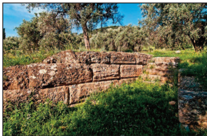
Τμήμα ελληνιστικού τείχους Αντίκυρας

Την άνοιξη του 210 π.Χ. η ρωμαϊκή ναυτική μοίρα υπό τον Μάρκο Βαλέριο Λαιβίνο απέπλευσε και πάλι από την Κέρκυρα. Περιπλέοντας την Λευκάδα έφτασε στην Ναύπακτο. Εκεί ο Λαιβίνος ανακίνησε στους Αιτωλούς την πρόθεση του να επιτεθεί στην παραλιακή Φωκική πόλη Αντίκυρα. Αυτοί προετοιμάσθηκαν για να τον συνδράμουν και σε τρεις ημέρες η πόλη δέχθηκε σφοδρή επίθεση από ξηρά και θάλασσα. Εντός ολίγων ημερών ακολούθησε η παράδοση της και όπως όριζε η συμφωνία οι Αιτωλοί πήραν τον έλεγχο της πόλης ενώ οι Ρωμαίοι εξανδραπόδισαν τον πληθυσμό. Μετά από αυτή την επιτυχία ο Λαιβίνος, οποίος εξελέγη ύπατος για το τρέχον έτος, επέστρεψε στη Ρώμη. Εκεί υποστήριξε πως εφόσον ο Φίλιππος ήταν ήδη εμπλεγμένος σε πολλά μέτωπα, μπορούσαν πλέον να αποσπά-