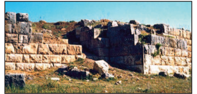
Οχυρώσεις αρχαίας Δρυμαίας

Διευθετώντας τα πράγματα στον Ονούτα ο Φίλιππος πολιορκήσε το ελεγχόμενο από τους Αιτωλούς Θρόνιο 15 , το οποίο και κατέλαβε.