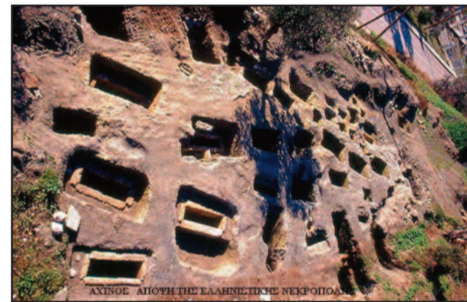
Ελληνιστική νεκρόπολη Εξίνου

Εν τω μεταξύ ο Φίλιππος δεν έμεινε αδρανής και έκανε και αυτός την παρουσία του στη νότιο Ελλάδα. Κατερχόμενος στην Φθιώτιδα πολιορκύσθηκε την πόλη του Εξίνου 5 (σημ. Αχινός). Ο Πολύβιος (9.41) περιγράφει λεπτομερώς τις πυρετώδεις προετοιμασίες του Φιλίππου με την κατασκευή πολιορκητικών χειλώνων, κριών, πύργων, λιθοβόλων (είδος καταπέλτη), στοών και σπράγγων. Παράλληλα εκφράζει τον θαυμασμό του για την γόνιμη Φθιωτική γη: «...Εντός ολίγων ημερών τα έργα ολοκληρώθηκαν καθώς ο τόπος παρίσχει σε αφθονία όλα τα αναγκαία μέσα, αφού ο Εξίνος ο οποίος βρίσκεται στον