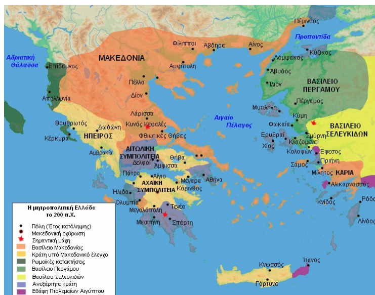
Η Μητροπολιτική Ελλάς το 200 π.Χ.

Οι Ρωμαίοι απεδείχθησαν άριστοι γνώστες της κατάστασης στην Ελλάδα, την οποία έχοντας διαβλέψει σε βάθος και με τρομερή ευστοχία έσπευσαν να εκμεταλλευτούν. Ο Φίλιππος είχε επιβάλλει την μακεδονική κυριαρχία στο μεγαλύτερο μέρος του ελλαδικού χώρου, πολλές φορές με δόλιο και στυγνό τρόπο, προκαλώντας σε πολλούς Έλληνες έντονη δυσαρέσκεια. Η Ρώμη, κινούμενη προς αυτή την κατεύθυνση, είχε ήδη εδώ και μια δεκαετία προσεγγίσει