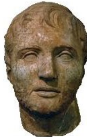
Τίτος Κοϊντίος Φλαμινίνος

Σύντομα οι Αιτωλοί προέβαλλαν αξιώσεις για ορισμένες πόλεις της Θεσσαλίας και της Φθιώτιδος 4 . Προς μεγάλη έκπληξη και οργή τους οι Ρωμαίοι απέρριψαν τα αιτήματα τους αποκαλύπτοντας τις πραγματικές προθέσεις τους. Συνειδητοποιώντας οι Αιτωλοί πόσο αφελέστατα είχαν εξαπατηθεί και καταστεί απλά ένα πiónι στα ρωμαϊκά σχέδια, εισήλθαν σε τροχιά ρήξης με τους πρώην πλέον συμμάχους τους, παρακινώντας τους υπόλοιπους Έλληνες να συνασπισθούν προ του ρωμαϊκού κινδύνου...! Καθώς όμως δεν διέθεταν ούτε την απαραίτητη στρατιωτική ισχύ ούτε το απαιτούμενο πολιτικό κύρος για να ηγηθούν ενός τέτοιου εγχειρήματος, χρειάζονταν έναν ισχυρό σύμμαχο στο πλευρό τους. Τελικά τον βρήκαν στο πρόσωπο του πανίσχυρου εκείνη την εποχή Αντίοχου Γ' του Μέγα, μονάρχη του αχανούς βασιλείου των Σελευκιδών 5 .