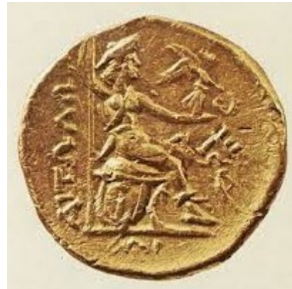
Χρυσός στατήρας Αιτωλικής Συμπολιτείας

Οι όροι πλέον ήταν ξεκάθαροι για τους Αιτωλούς. Αντιπροσωπεία τους επισκέφθηκε ξανά τον Γλαβρίωνα, ο οποίος εκτός της συνθηκολόγησης απαίτησε και την παράδοση ορισμένων υψηλά ιστάμενων προσώπων. Οι Αιτωλοί απεκρίθησαν πως την απάντηση επί αυτού του θέματος θα την έδινε η Εθνοσυνέλευση, το ανώτατο εκτελεστικό τους όργανο, και γι' αυτό ζήτησαν άλλες δέκα ημέρες ανακωχής. Οι Ρωμαίοι συμφώνησαν. Τότε όμως κατέφθασε ο στρατηγός τους Νικάνδρος, ο οποίος είχε αποσταλεί στον Αντίοχο. Αποβιβαζόμενος στα Φάλαρα, έκανε μια στάση στην Λαμία όπου άφησε τα χρήματα που είχε παραλάβει από τον Σελευκίδη μονάρχη και τελικά έφθασε στην Υπάτη όπου οι Αιτωλοί αξιωματούχοι συζητούσαν την προοπτική ειρήνης. Εκεί ανέφερε τις δεσμεύσεις του Αντίοχου για κινητοποίηση τεραστίων δυνάμεων, γεγονός που ανέβασε το ηθικό τους. Αποτέλεσμα ήταν να απορριφθούν οι όροι των Ρωμαίων και ο πόλεμος να συνεχισθεί.