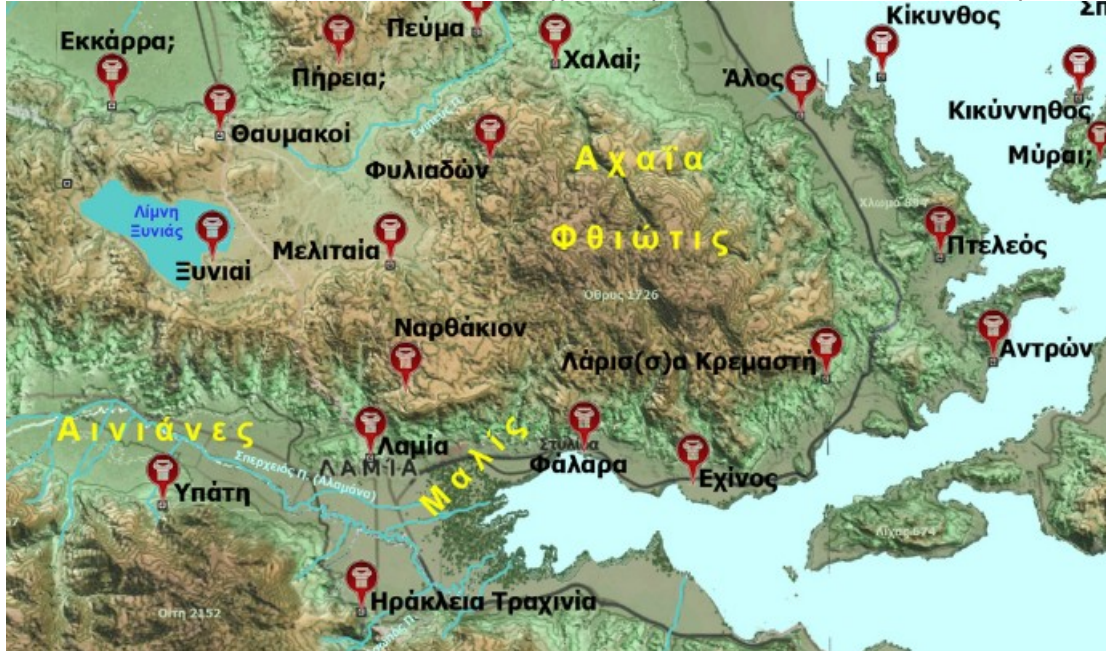
Χάρτης αρχαίας Φθιώτιδος

Στρατοπεδεύοντας εντός της στενωπού ο Αντίοχος πραγματοποίησε αμυντικά έργα με τάφρους, οδοφράγματα και τείχος σε μερικά σημεία για την επερχόμενη μάχη. Ακολούθως έστειλε ένα απόσπασμα Αιτωλών να ενισχύσει την Ηράκλεια και ένα άλλο την Υπάτη.