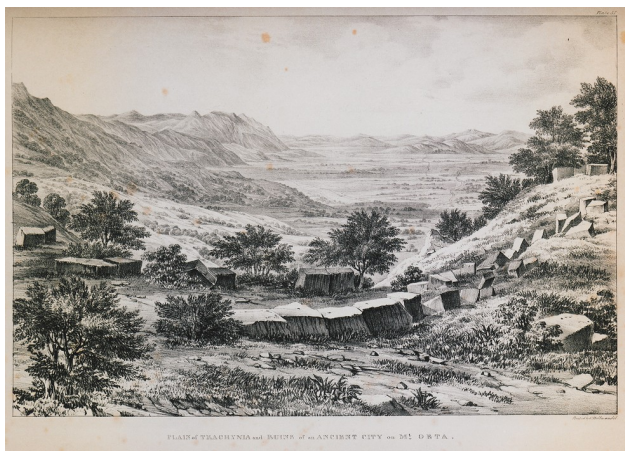
Αρχαία ερείπια στην πεδιάδα της Ηράκλειας Τραχίνας, του Edward Dodwell

Έπειτα από την νίκη στις Θερμοπύλες και την αποχώρηση του Αντιόχου, ο Γλαβρίων πραγματοποίησε μια σύντομη και αναίμακτη εκστρατεία σε Φωκίδα και Βοιωτία. Δεχόμενος την υποταγή των φοικικών και βοιωτικών πόλεων που είχαν συνταχθεί με τον Αντίοχο, εισήλθε χωρίς αντίσταση στην Χαλκίδα με αποτέλεσμα και οι υπόλοιπες Ευβοϊκές πόλεις να δηλώσουν υποταγή. Ακολούθως ο Ρωμαίος ύπατος επέστρεψε στις Θερμοπύλες. Από εκεί έστειλε μήνυμα στους Αιτωλούς ψέγοντας αφ' ενός τις κενές υποσχέσεις του Αντιόχου, και αφετέρου τους συμβούλευσε να συνεντισθούν, να παραδώσουν την Ηράκλεια και να εκλιπαρήσουν την Σύγκλητο να συγχωρήσει την τρέλα τους (Τ.Λιβ.36,22). Οι Αιτωλοί προφανώς δεν απεδέχθησαν αυτούς τους ταπεινωτικούς όρους και απεκρίθησαν πως την απάντηση θα την έδιναν τα όπλα. Έτσι ο Γλαβρίων μετέφερε τον στρατό του από τις Θερμοπύλες στην Ηράκλεια, θέτοντας την υπό πολιορκία.